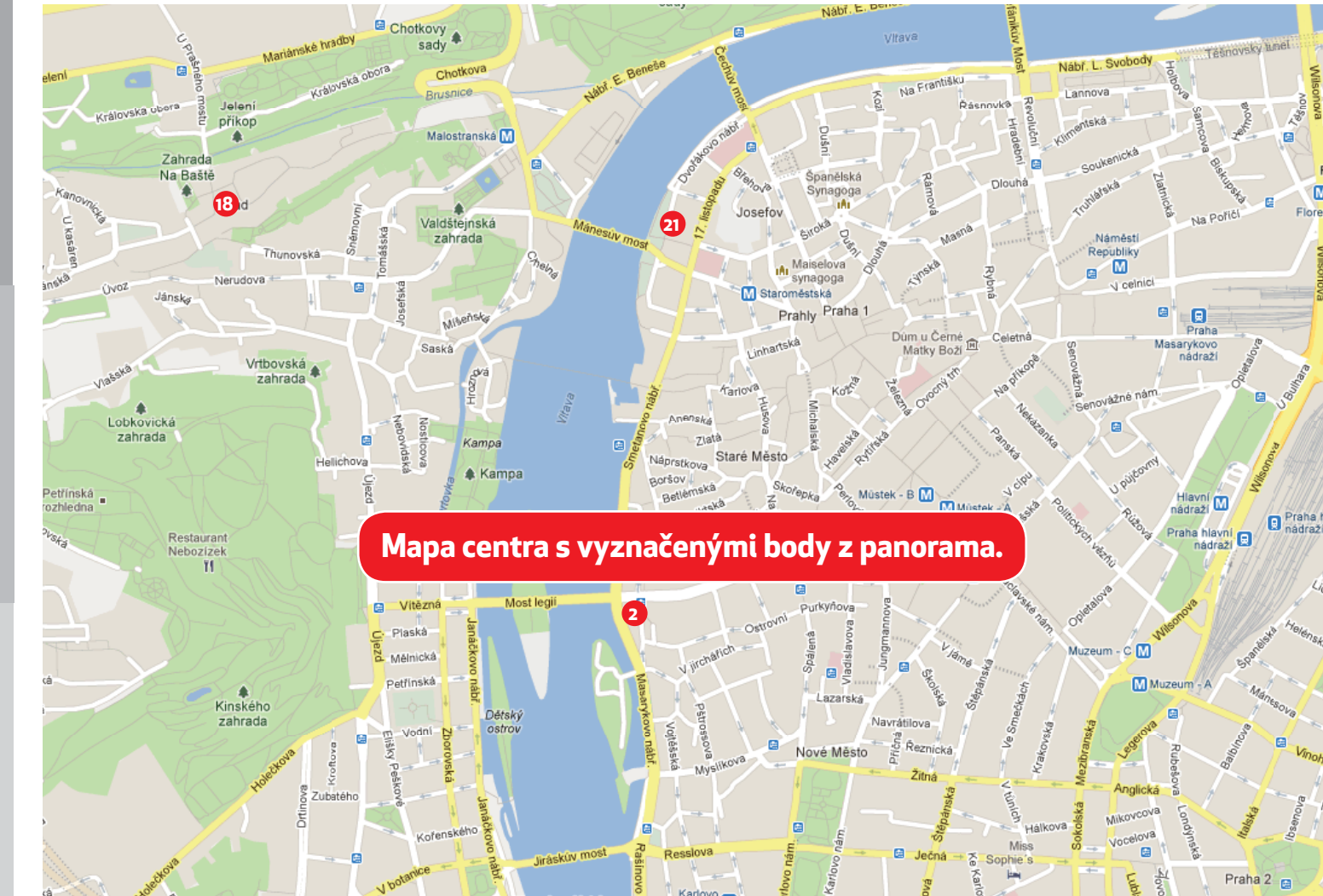
Mapa centra s vyznačenými body z panorama.